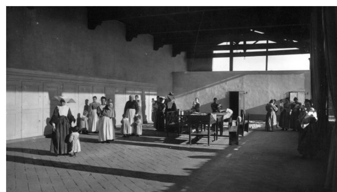
Foto storica nella sezione "Le storie e percorsi di vita". Galleria museale dell'Istituto Innocenti di Firenze

In Toscana due casi emblematici sono l'Ospedale degli Innocenti di Firenze e l'Ospedale di Santa Maria della Scala di Siena dove molte donne (di solito madri nubili o vedove o madri cui era morto il figlio neonato), legate con regolare contratto, allattavano i trovatelli (fino a cinque ognuna), per un periodo che poteva arrivare fino a diciotto mesi; dopo iniziava lo svezzamento per cui erano impiegate le balie "asciutte".